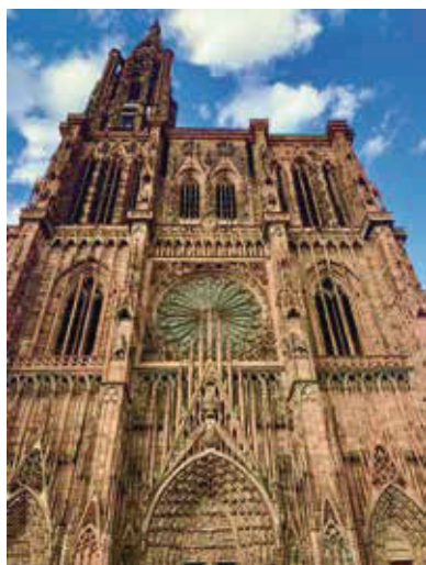
聖母大教堂是比利時迄今最大的哥特式大教堂