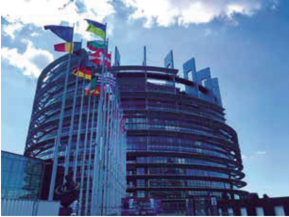
歐盟總部所在地——比利時首都布魯塞爾