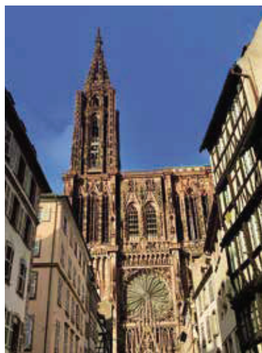
教堂高達123米的塔尖是安特衛普最優美的地標，被譽為中世紀的摩天大樓