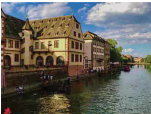
童話般的運河城市