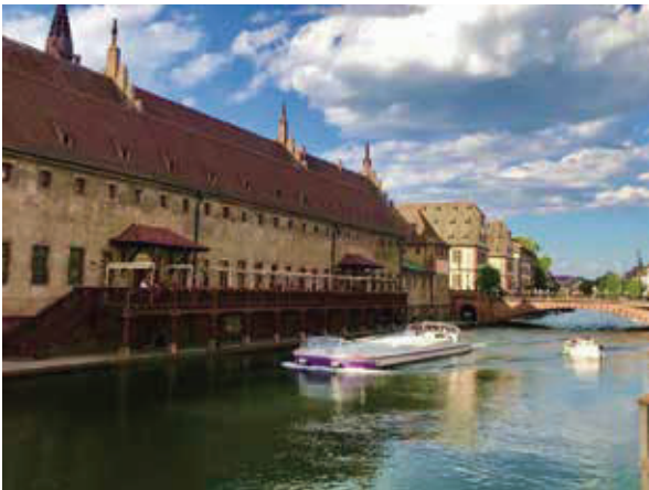
中央運河值得坐船遊覽的哦