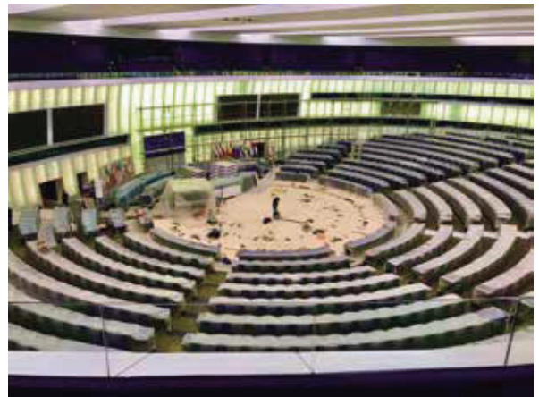
歐洲議會民主中心，不能錯過的半圓形議場