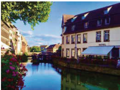
照片看起來像明信片