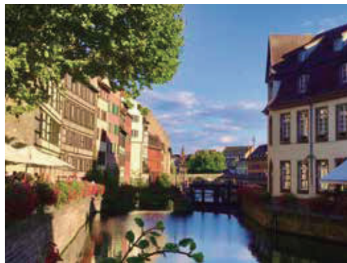
藍天白雲綠樹，色彩全都配合的恰到好處的運河都市