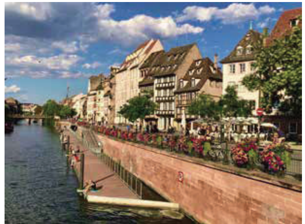
中央運河是比利時瓦隆大運河的一條運河，全長20.9公里