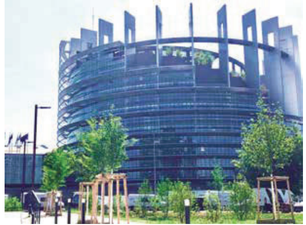
花百億蓋12年 歐盟新總部2016年完工