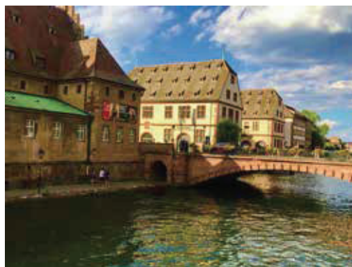
中央運河是整個城市最大的一條貨物運輸的場所，運河的河道非常的寬闊